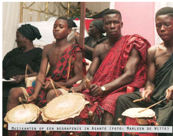
MUZIKANTEN OP EEN BEGRAFENIS IN ASANTE

Nt. Er is geen vreugde in het leven van een aberewa,