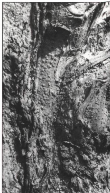
Foto's genomen door de auteur in september 1996 in Kwahu-Tafo, Ghana.