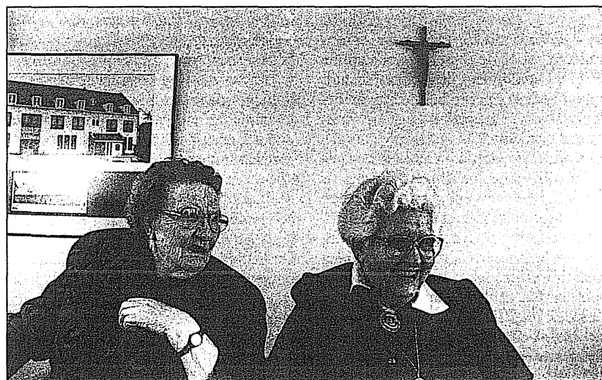
Luisteren naar wat ouderen zélf belangrijk vinden.

Bovendien zijn cijfers wat veel beleidsmakers en opdrachtgevers wensen. Antropologen kunnen zich niet onttrekken aan die dominante eis in de cultuur ►