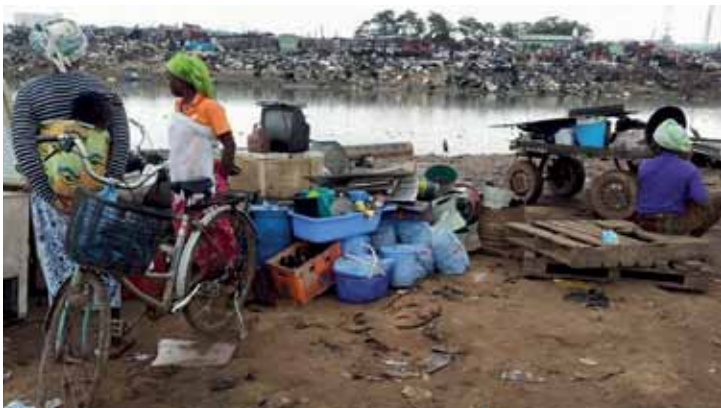
Sodom and Gomorrah

(1998) Akan shit: Getting rid of dirt in Ghana. Anthropology Today 14 (3) : 8-12. <