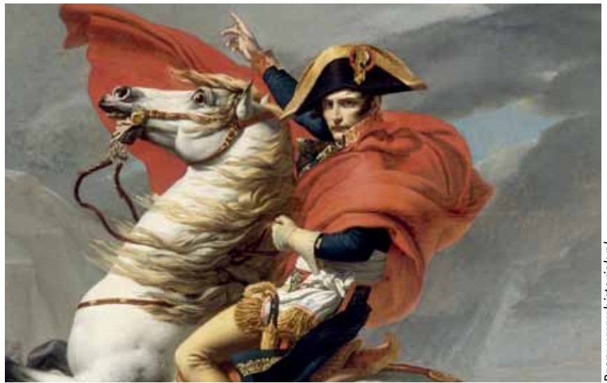
Napoleon 'voor de troepen uit!'