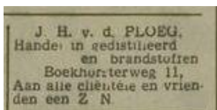
Leidsche Courant 31 december 1960

Eigenlijk zou de titel van deze aflevering 'De Brandstoffenhandelaar' moeten zijn, want de mensen die hier voorbij zullen komen verkochten ongeveer alles wat brandbaar was: kolen, petroleum, benzine, gas, turf, takkenbossen en zelfs 'gedistilleerd', zoals brandewijn. Op dit laatste product na, allemaal materialen die we vandaag de dag proberen uit te bannen. Zo raar kan het lopen met oude beroepen. Maar 'brandstoffenhandelaar' is een woord dat niemand gebruikte en alleen op borden, ruiten en rekeningen en in officiële berichten en nieuwjaarsgroeten geschreven stond.