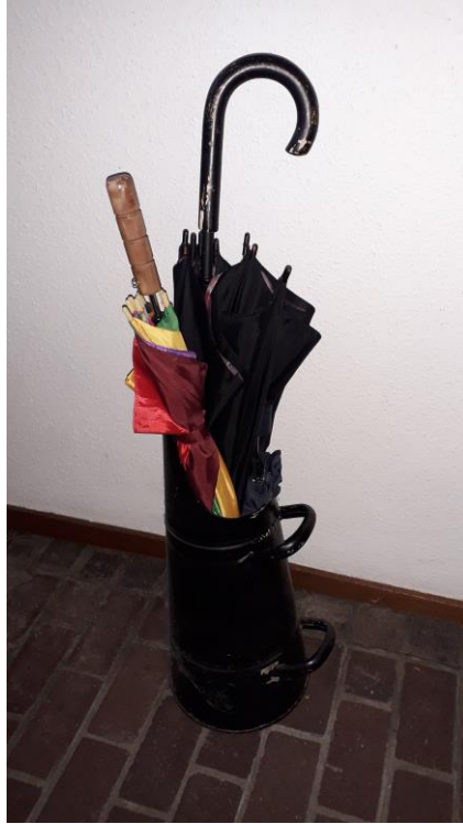
Kolenkit als parapluhouder.