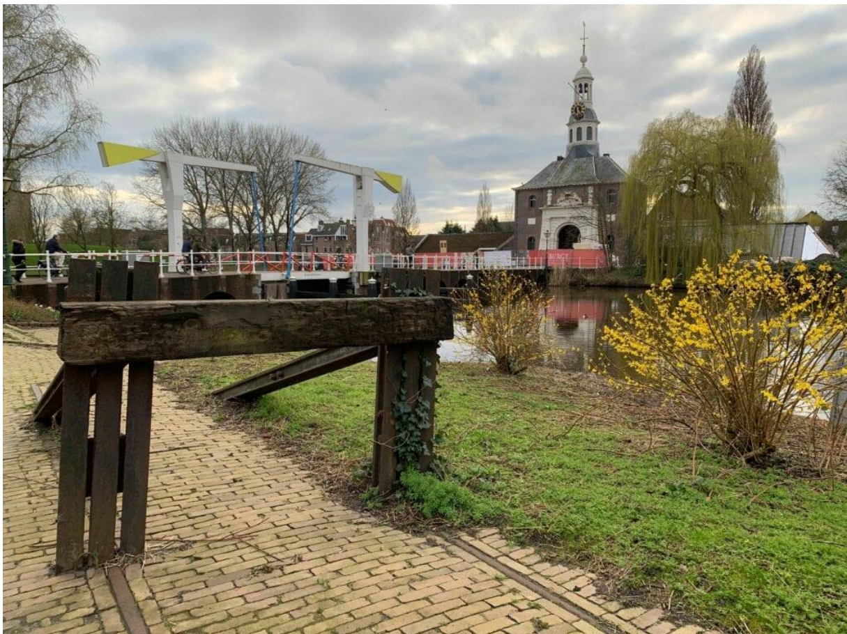
Stootblok, het enige dat er nog over is van het Goederenstation Herensingel Leiden.