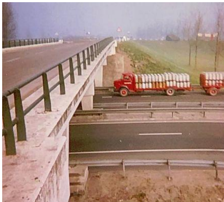
Piet Olijerhoek onderweg, ca. 1970