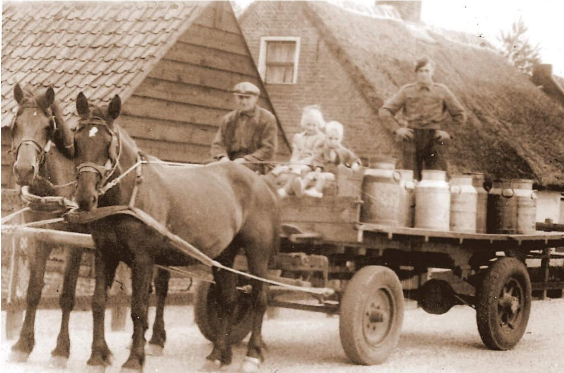
Bij gebrek aan een foto uit Alkemade, deze met paarden bespannen melkwagen uit Hei- en Boeicop, in de provincie Utrecht, rond 1950.