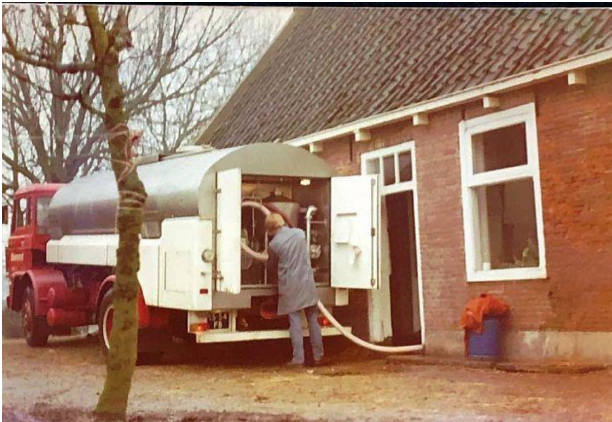
Piet Olijerhoek bij Nic van der Salm in Zoeterwoude. De melk wordt overgepompt, ca. 1975.