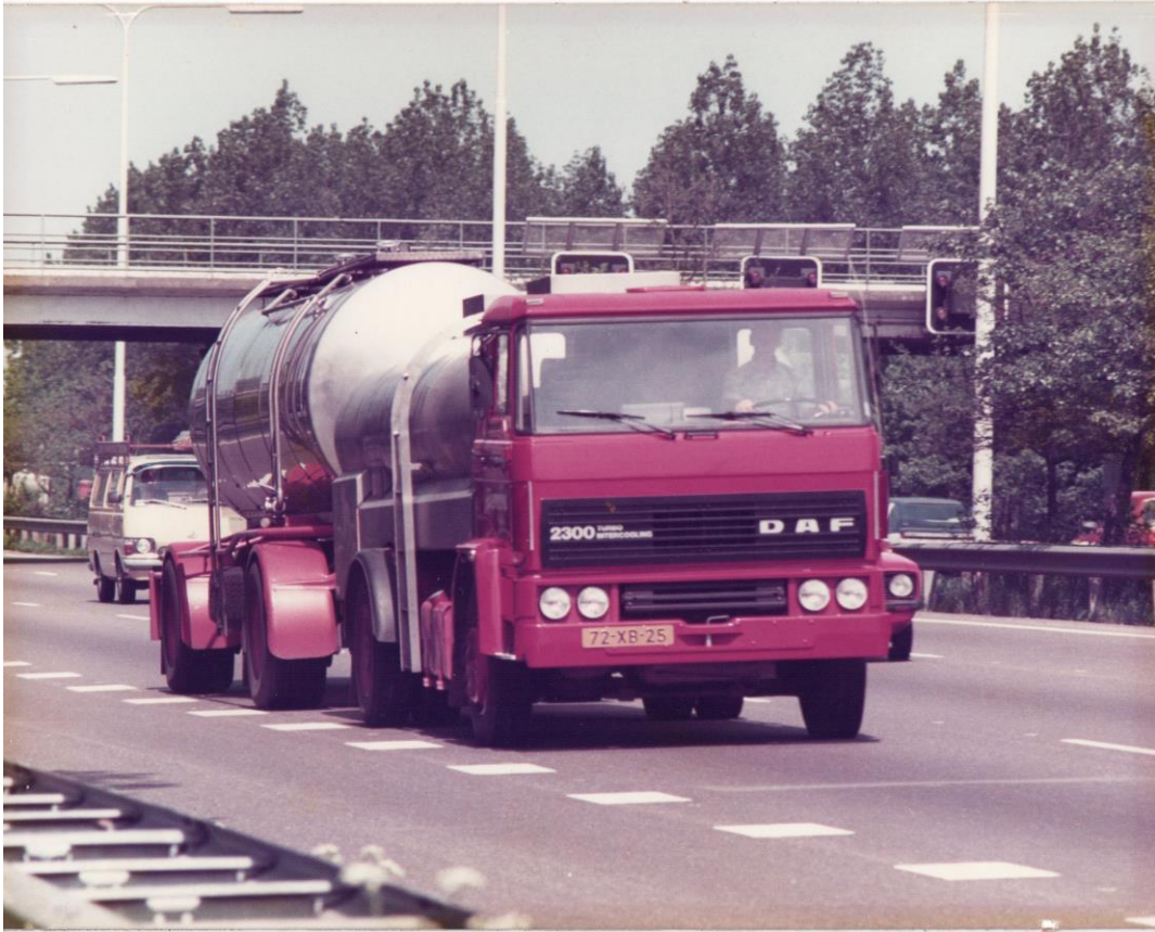
Kees Zandvliet onderweg in zijn melktankwagen, een DAF 2300, type RMO (Rijdende Melk Ontvangst) ca. 1983.