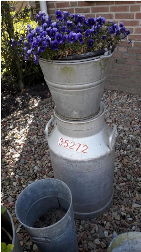
Melkbus met viooltjes aan de Zwarteweg