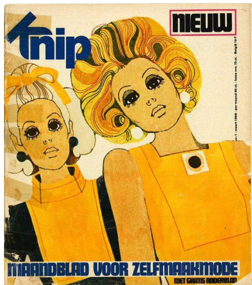
De eerste Knip, maart 1969