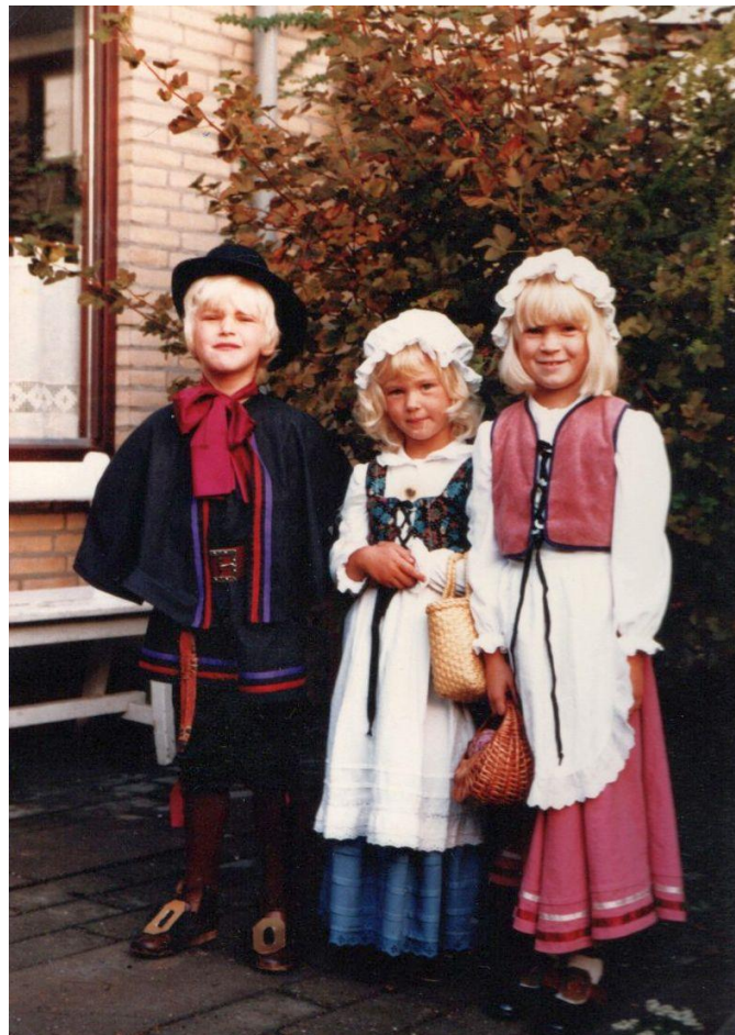
Een staaltje zelfmaakmode in ons eigen gezin (schoolfeest Oude Wetering, 1982)