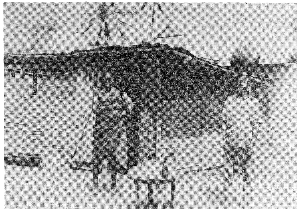
1. Palmwijnbars zijn niet weg te denken uit de Ghaneese dorpen. Het is bij uitstek de plaats waar een antropoloog deel kan nemen aan informele discussies over tal van onderwerpen.

Om te beginnen kan men zich afvragen of de vervolg op pagina 3