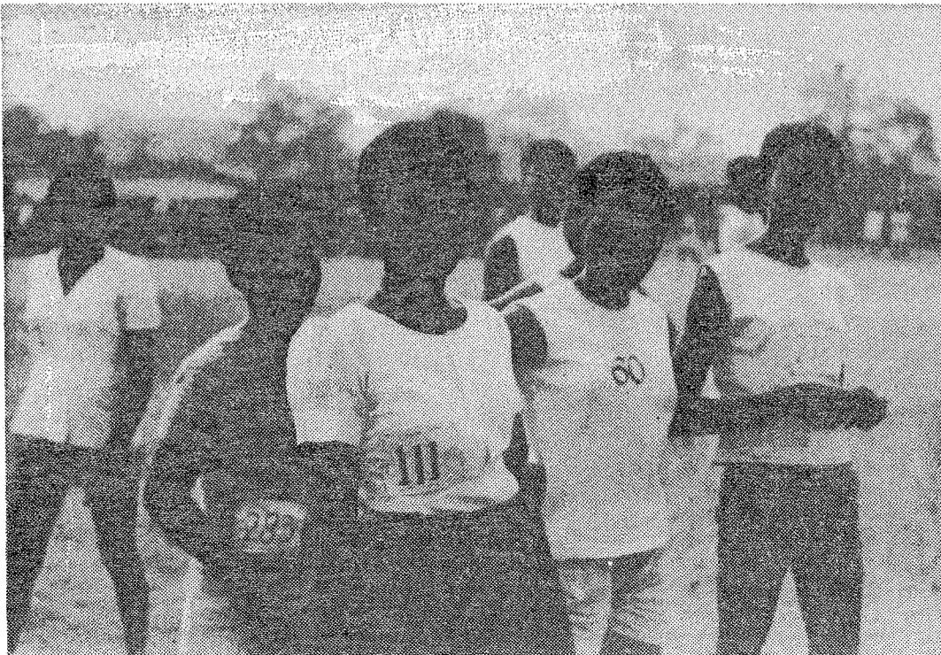
Schoolmeisjes in sporttenue. Abortus provocatus komt het meest voor onder vrouwelijke scholieren.

Stelling nr. 8 bij het proefschrift 'On the impedance measurements with the AgI-electrolyte solution interface'. I. Influence of temperature, specific adsorption and Faraday impedance, waarop D. A. de Vooy 24 mei 1976 promoveerde tot doctor in de wiskunde en natuurwetenschappen aan de Universiteit te Utrecht.