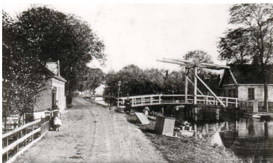
Een oude Ansichtkaart van het dorp Oud Ade. In de verte links (toen nog) Café 'Klein Rustoord'.