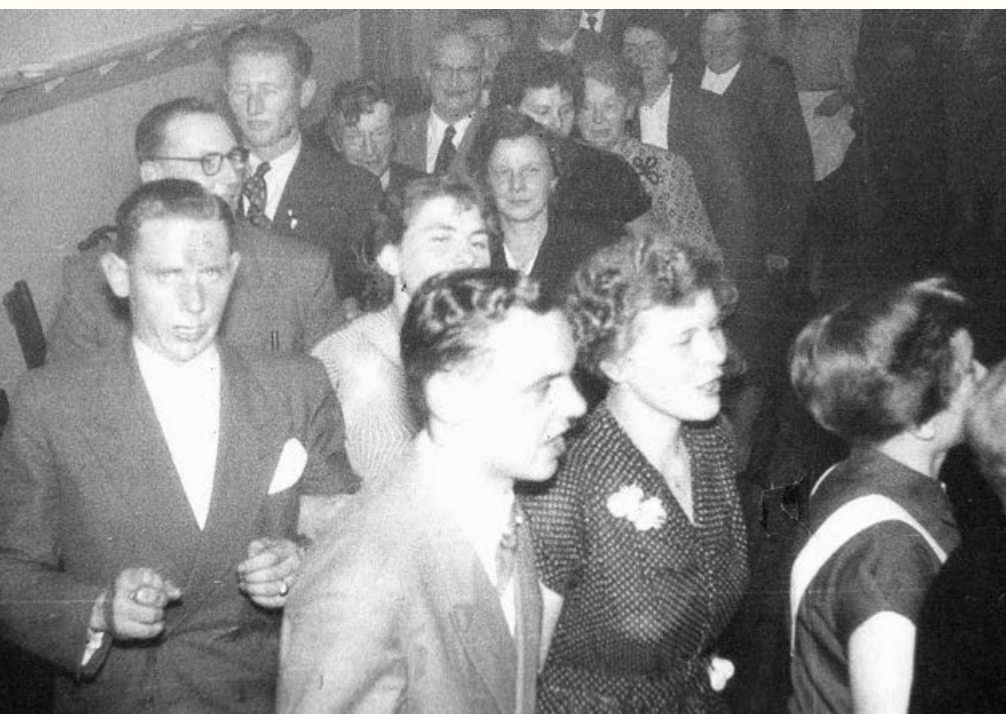
Openingsfeest: polonaise hoorde er bij in de jaren vijftig. Veel bekende gezichten.