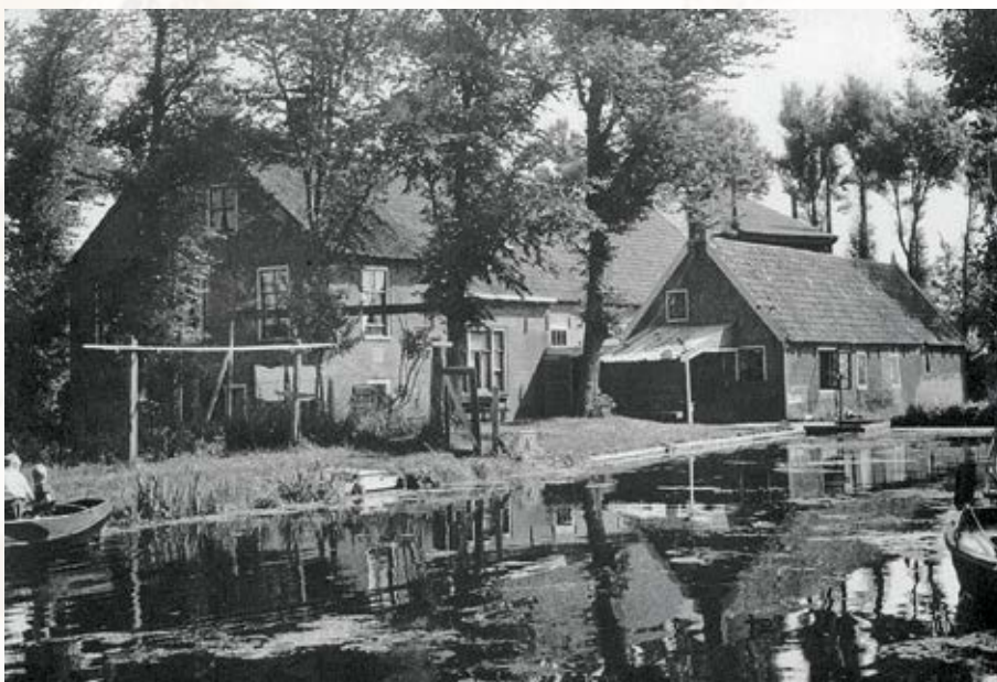
De boerderij Blankenhoeve.

Na deze 'introductie' volgt hieronder een geanimeerd gesprek met Theo waarin ik hem een aantal vragen voorleg: