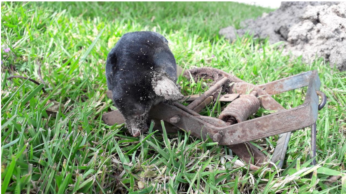
Voor lezers met een sterke maag: de gevangen mol uit de vorige foto.