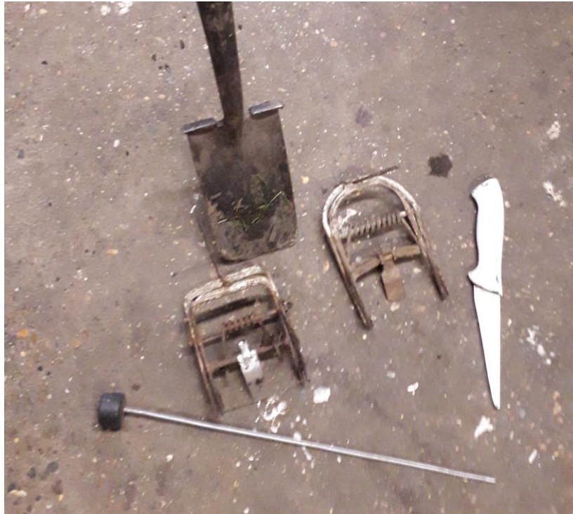
Instrumentarium van Peter van der Ploeg: prikker om de gangen te vinden, Amerikaanse klemmen (linkse zelf-gemaakt), mes om rit open te snijden, en steekschop.