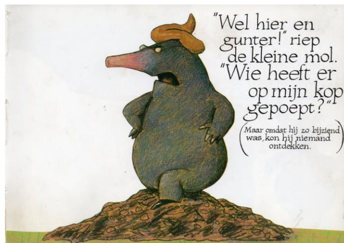
Kijk- en voorleesboekje.