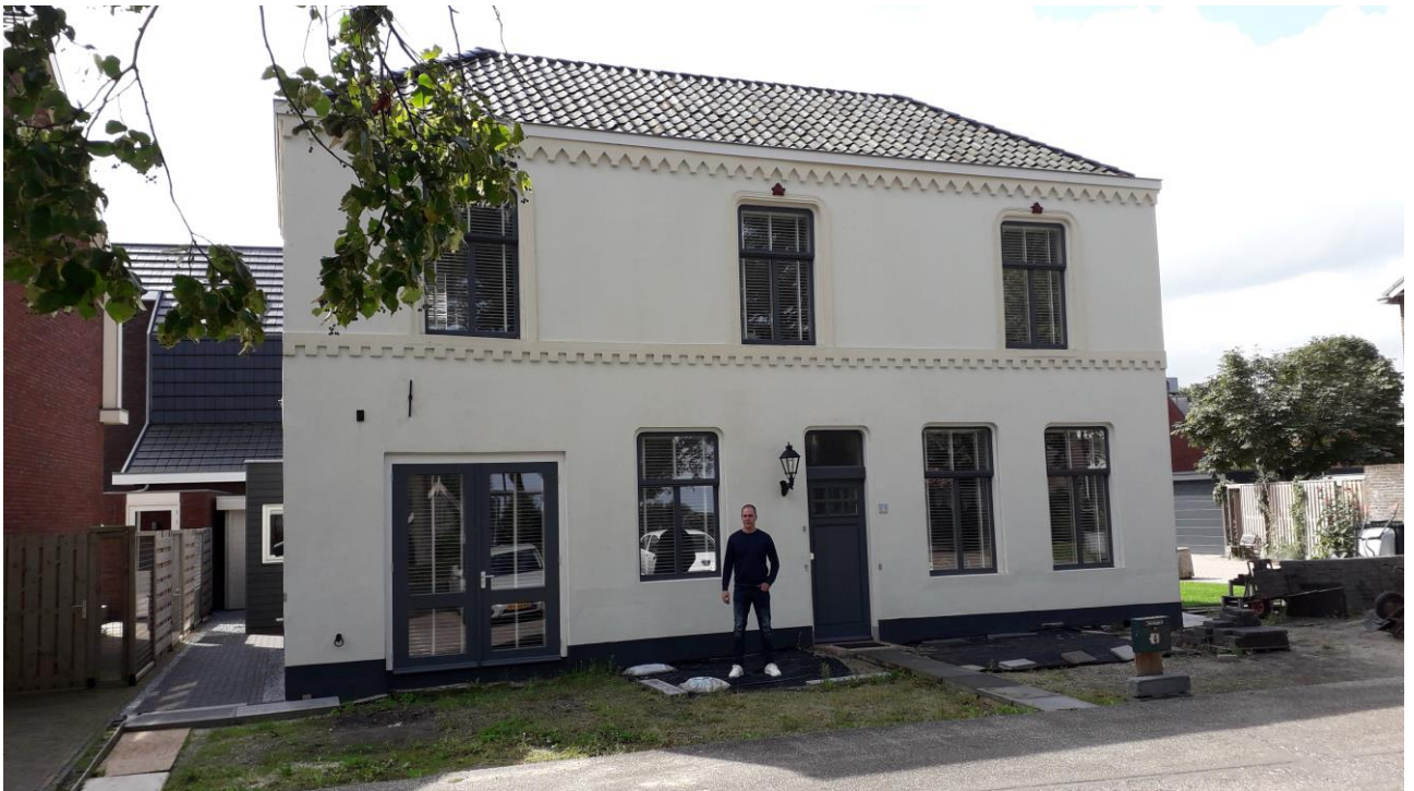
Kolk 14: van schoolgebouw naar noodslachterij naar pronkstuk in 2021, met de eigenaar Sander van der Lelij.