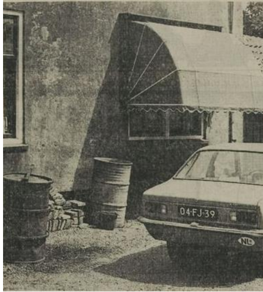
De regenton met slachtafval naast het huis van de noodslachter (Leidsche Courant 14 juli 1976)