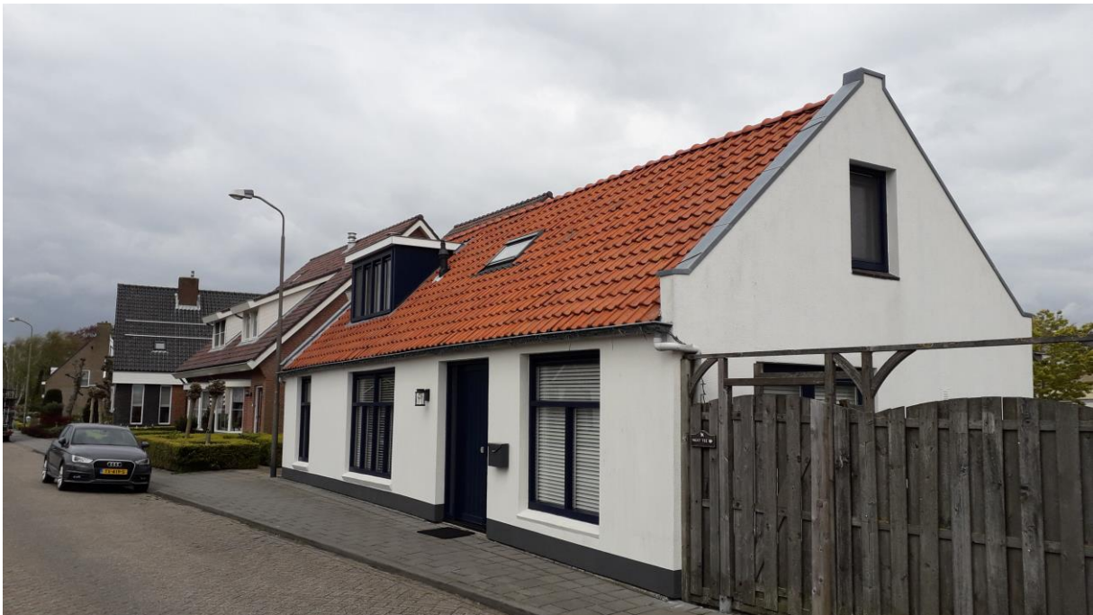
De oude slachterij aan de Pastoor van der Plaatstraat, verkocht en gerenoveerd, zoals hij er nu (2021) uitziet.