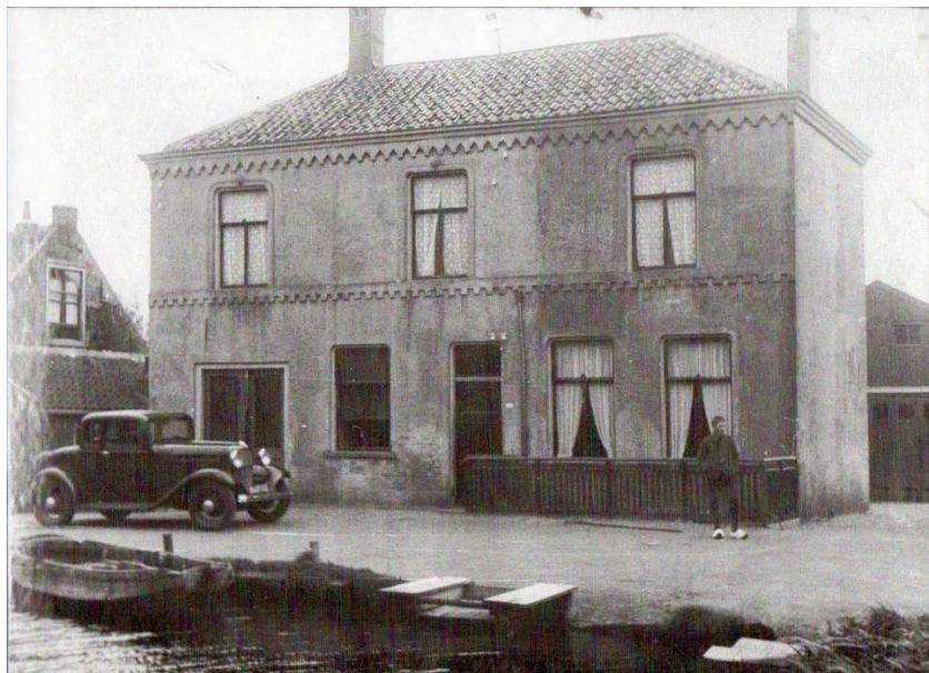
De noodslachterij, Kolk 4, Oud-Ade. Jaar onbekend. Links de auto van de Keurmeester. Het water van de Kolk (na de oorlog gedempt) is duidelijk te zien, met roeiboot en houten boenstoep. De persoon rechts is onbekend.