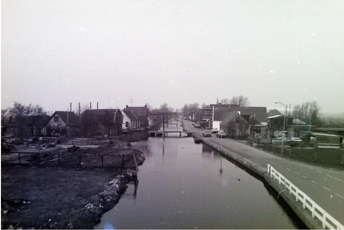
Rechts de noodslachterij van Disseldorp, Pastoor van der Plaatstraat 127 in Rijpwetering, gezien vanaf het viaduct, omstreeks 1965/1970.