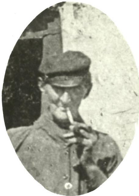
Willem Disseldorp (1827—1899)