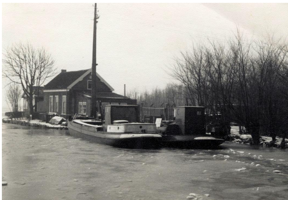
De thuishaven bij het Vennemeer met (links) de eerste schuit van Koos Koek en een schuit van een collageschipper die daar overwinterde (rond 1960).