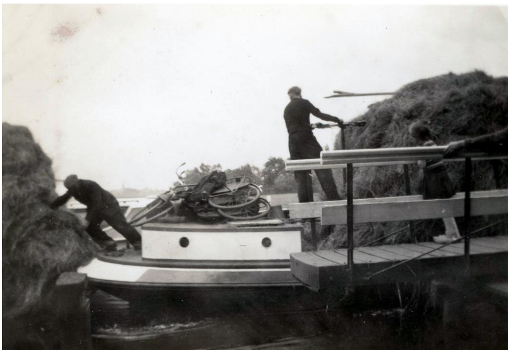
Een vracht hooi was altijd een uitdaging. Het hooi werd zo hoog opgetast dat de schipper er niet meer over heen kon kijken, ondanks dat het stuur hoog werd gezet. Dus stond er iemand op de lading voor aanwijzingen. Ook hing er achter de schuit een vlet met hooi, wat vooral op de foto bij de draaibrug van boerderij het Klaverblad goed te zien is. Soms waren er zelfs twee aanhangers met hooi (beide foto's rond 1960).