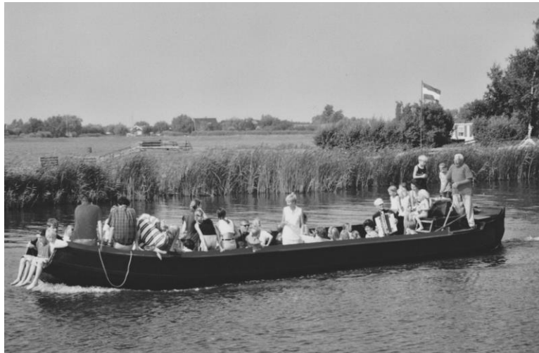
Uitje met de veeschouw van Jaap van der Star (Rijpwetering). Kinderen zitten in de open bek. Muziek van een accordeon.