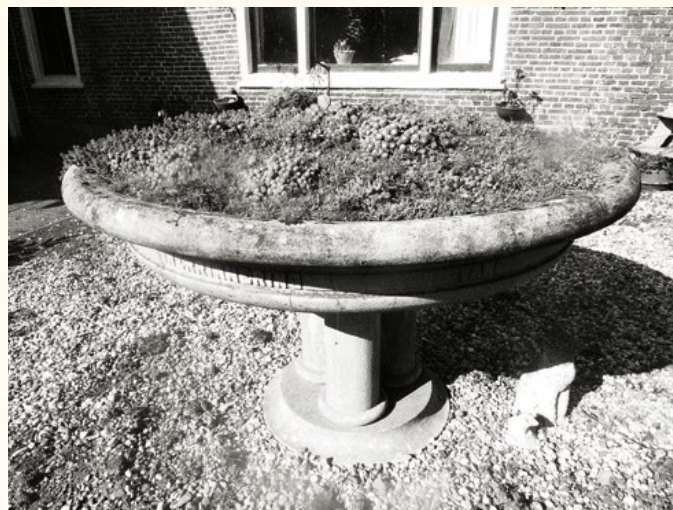
“Herinnering van de ondergedoken Sport”.