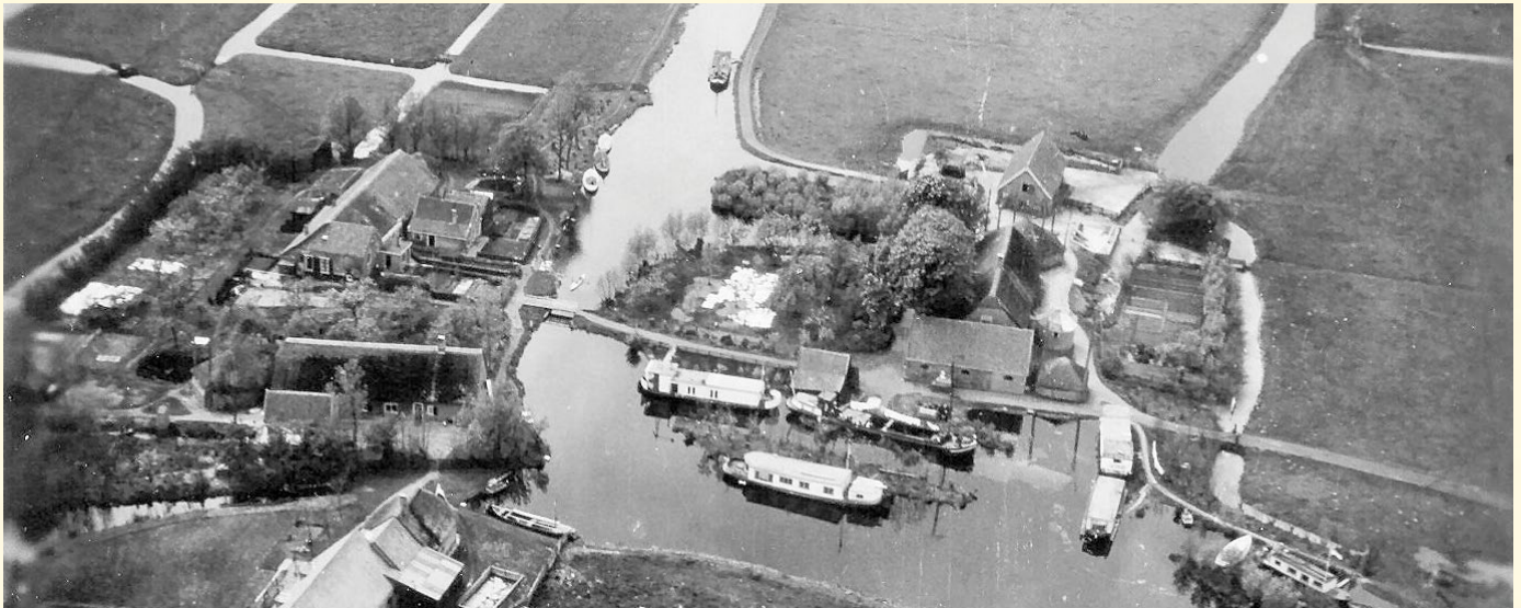
Einde Zwarteweg, Oud Ade, mei 1945.

met zgn. kakies, kaas, meel, chocolade, blikken vlees, vis en groenten en nog wat andere levensmiddelen.